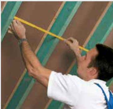
Fig. 1 Meet de ruimte tussen 2 kepers en voeg hier 1 à 2 cm aan toe. Mesurez la distance entre 2 chevrons et ajoutez-y 1 à 2 cm.

L'application d'un pare-vent/vapeur est indispensable pour assurer l'étanchéité à l'air et à la vapeur d'eau (fig.4). Le pare-vapeur à base de polyamide au pouvoir asséchant est décrit dans la fiche ISOVER vario® KM duplex.