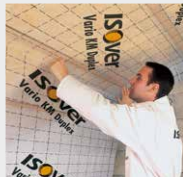
Fig. 4 Breng een lucht/dampscherm aan, zoals ISOVER vario® KM duplex.

Appelez un pare-vent/ vapeur, comme l'ISOVER vario® KM duplex.