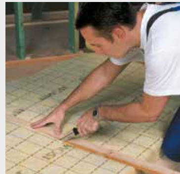
Fig. 2 Snij de gewenste breedte langs de maatstrepen af met een lat en het ISOVER isolatiemes.

A l'aide du couteau ISOVER coupe laine et d'une latte, coupez à dimension en suivant les prémarquages.