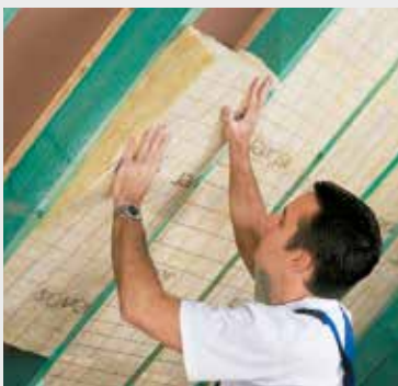
Fig. 3 Klem de isolatie tussen de kepers. Coincez l'isolation entre les chevrons.

A l'aide du couteau ISOVER coupe laine et d'une latte, coupez à dimension en suivant les prémarquages.